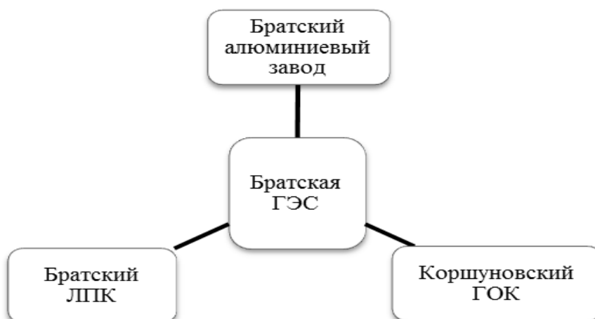
Рис. 3. Схема производственного комплекса на примере Братско-Усть-Илимского ТПК