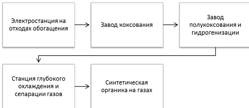
Рис. 2. Схема производственного комбината на примере углехимического комбината в Черемхове

спускаясь сверху вниз от готового изделия (готовой машины или сложного химического продукта и др.), возникают производства по изготовлению вспомогательных частей, материалов, химикалиев, реактивов, аппаратуры, приборов и т. д., так называемые «смежники», «спутники» – заводы, возникающие в порядке «производственной кооперации» и пр., в силу необходимости