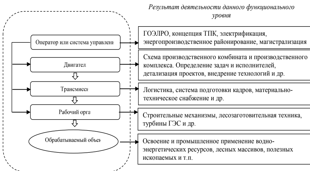
Рис. 4. Функциональное разделение труда в системе районирования и территориально-производственных комплексов СССР

2. Братско-Усть-Илимский территориально-производственный комплекс является ориентиром для других малоосвоенных территорий Сибири и Дальнего Востока. На его примере исследована структура ТПК с точки зрения функционального разделения труда. Под функциональным разделением