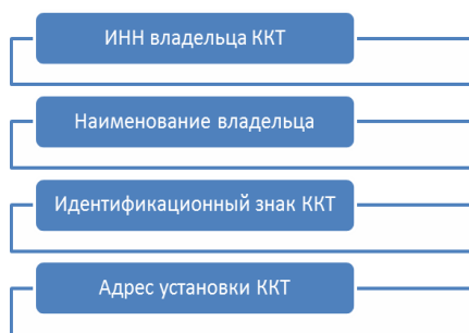
Рис. 4. Информация о ККТ налогоплательщика, выдаваемая при активизации QR-кода (составлено авторами)

логоплательщика, а также на его счетах-фактурах.