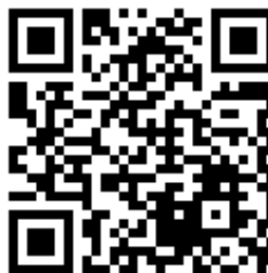
Рис. 2. Пример QR-кода, содержащий гиперссылку на страницу интернет-ресурса «Википедия» 20

При помощи QR-кода можно закодировать любую информацию, например: текст, номер телефона, ссылку на сайт или визитную карточку (рис. 2) [18].