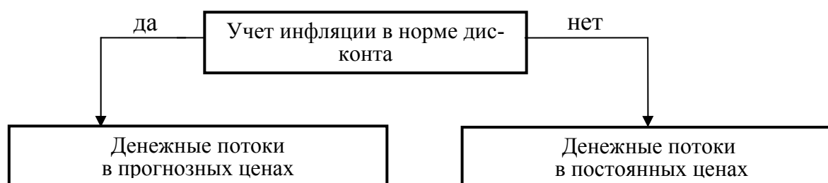
Рис. 1. Учет инфляции при обосновании нормы дисконта

На рис. 1 наглядно изображен вышеописанный алгоритм.