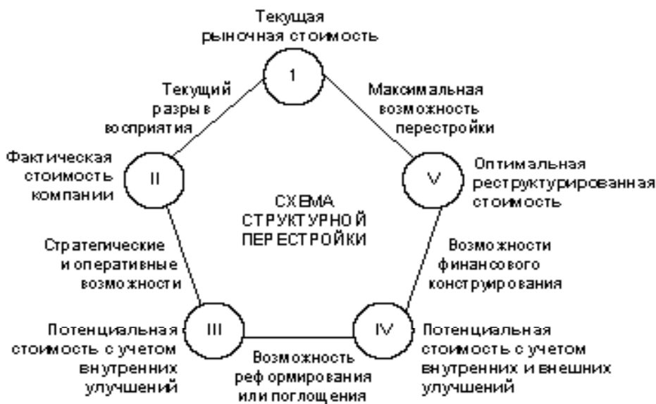
Рис. 1. Цикл управления стоимостью бизнеса 3

В соответствии с представленной выше терминологией в ряде зарубежных изданий излагается методология управления стоимостью бизнеса (предприятия), которая в конечном итоге ориентирована на управление его рыночной стоимостью. Как правило, данная методология представляется в виде пятиугольника, отображающего цикл управления стоимостью бизнеса, подобно тому, что изображен на рис. 1.