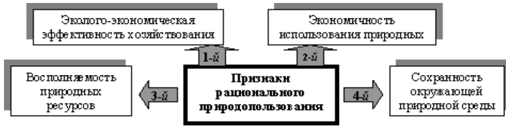
Рис. 1. Признаки рационального природопользования