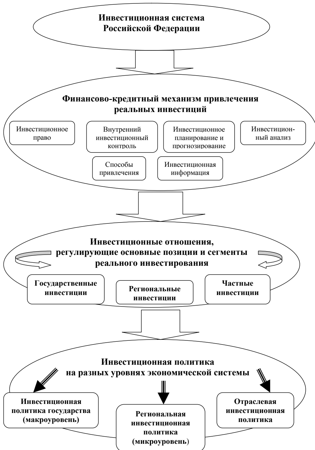
Рис. 1. Роль финансово-кредитного механизма привлечения реальных инвестиций в управлении инвестиционными отношениями [10]