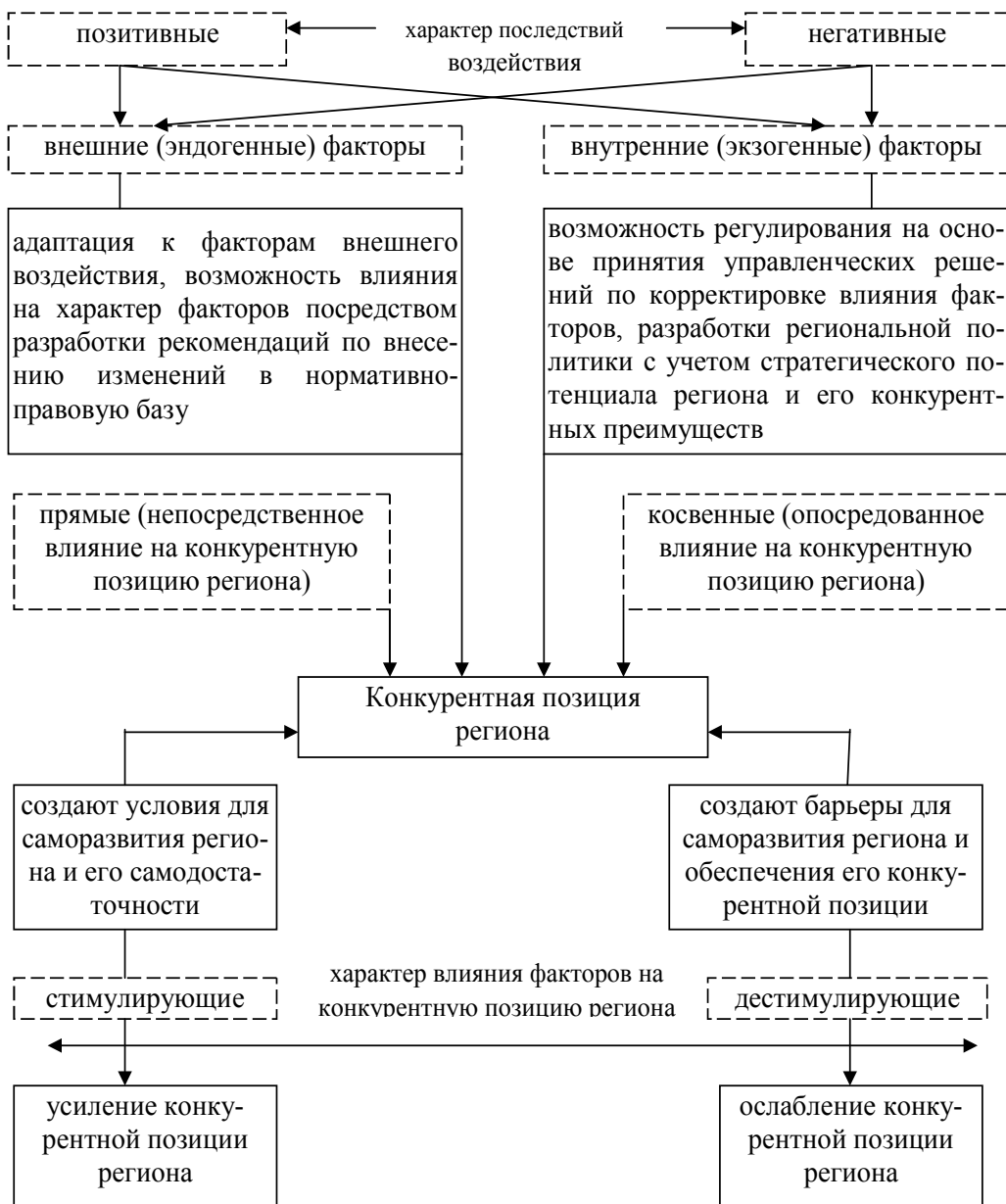
Рис. 2. Схема влияния факторов на обеспечение устойчивой конкурентной позиции региона

Взаимозависимость факторов необходимо учитывать при управлении ими для обеспечения устойчивой конкурентной позиции региона и повышения его конкурентоспособности (рис. 2).