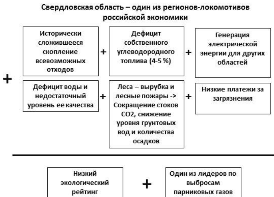
Рис. 2. Эколого-энергетическая ситуация Свердловской области