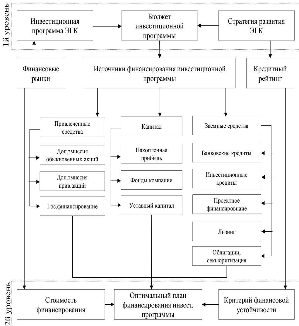
Рис. 2. Методический подход к оптимизации финансирования инвестиций энергогенерирующей компании

где R_e – требуемая доходность к собственному капиталу;