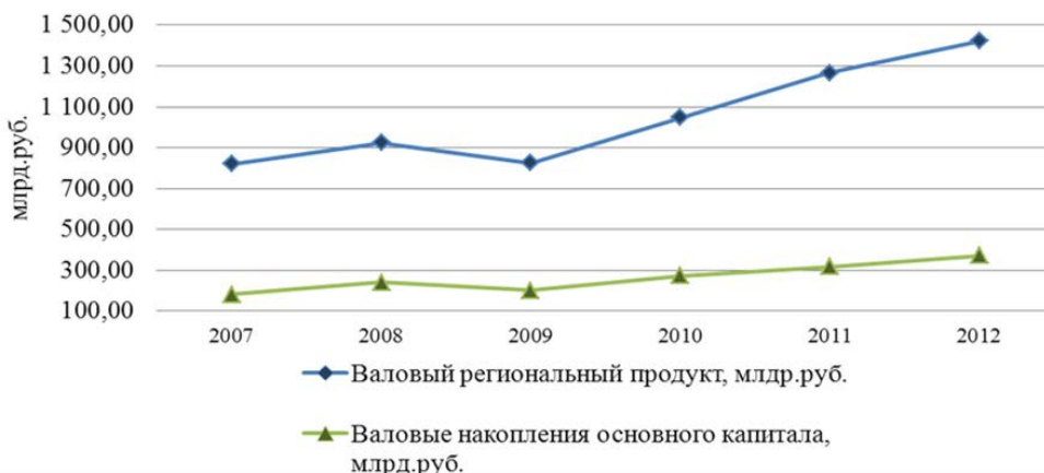
Рис. 2. Динамика ВРП и валовых накоплений основного капитала Свердловской области