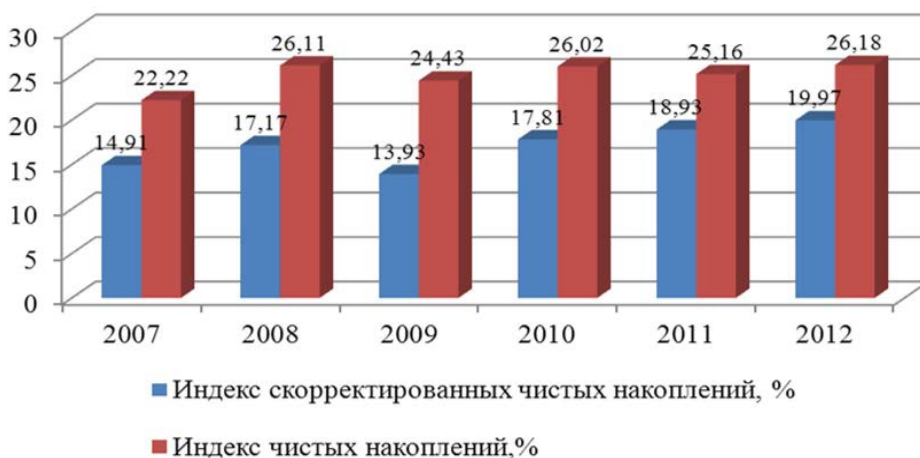
Рис. 3. Динамика индексов чистых накоплений Свердловской области [4]

Как показывает динамика индексов (рис. 5), после расширения экологической составляющей, скорректированные чистые