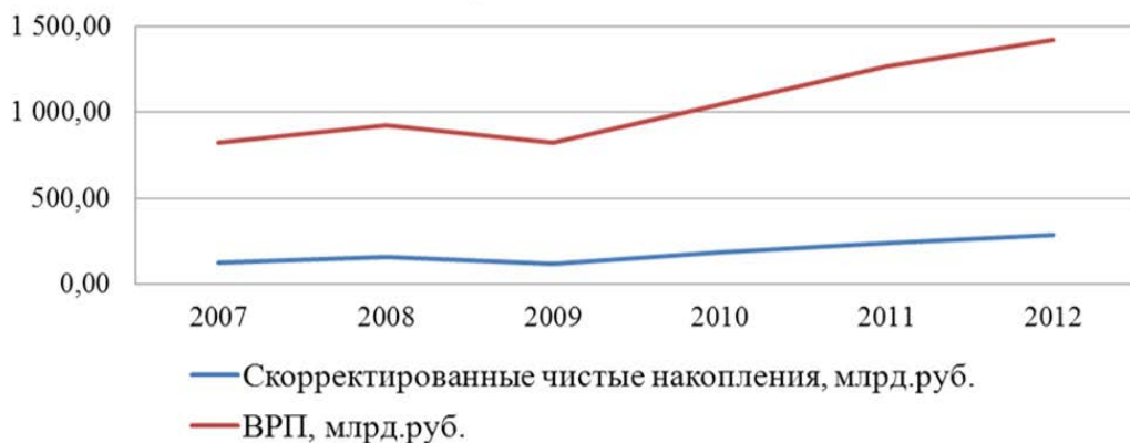
Рис. 4. Динамика ВРП и скорректированных чистых накоплений [4]

Сводная оценка отражает способность региона противостоять действию комплексных угроз, поскольку входящие в нее индикаторы характеризуют интенсивность эксплуатации природной среды и изменение экономического качества ОС (табл. 5). Область допустимых значений сводной