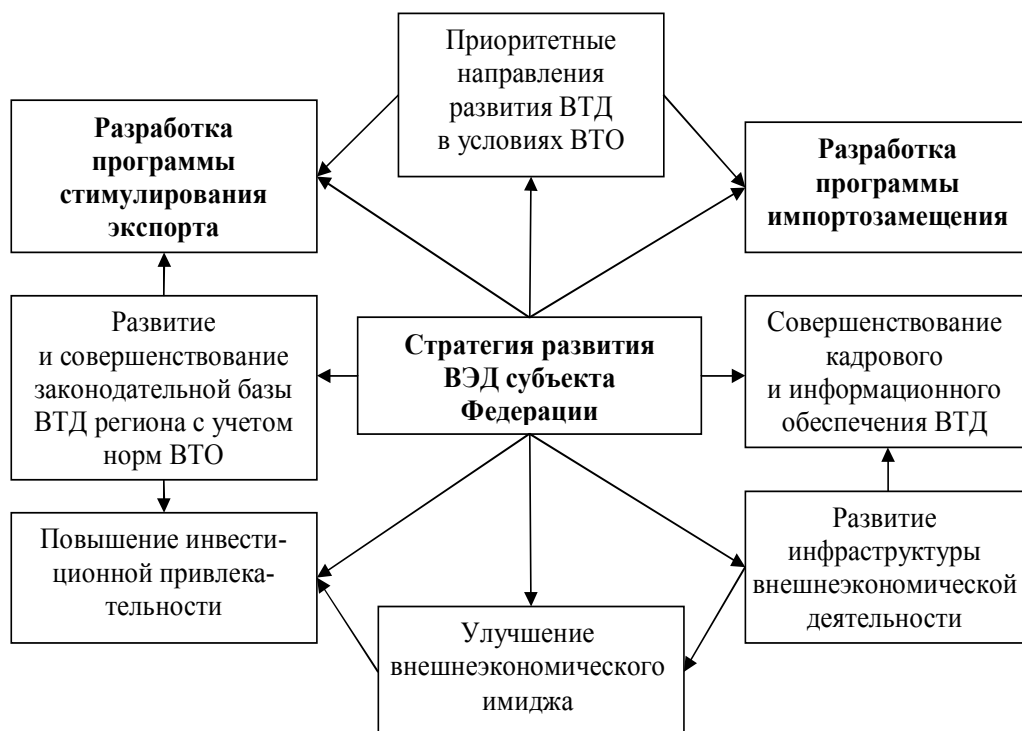
Рис. 1. Стратегия развития ВТД субъекта Федерации в условиях членства России в ВТО

По мнению авторов, представляет определенный научный и практический интерес анализ последствий присоединения России к ВТО в стартовых условиях. Однако до настоящего времени единая методика оценки влияния членства России в ВТО на внешнеторговую деятельность отсутствует. С учетом этого ограничимся проведением