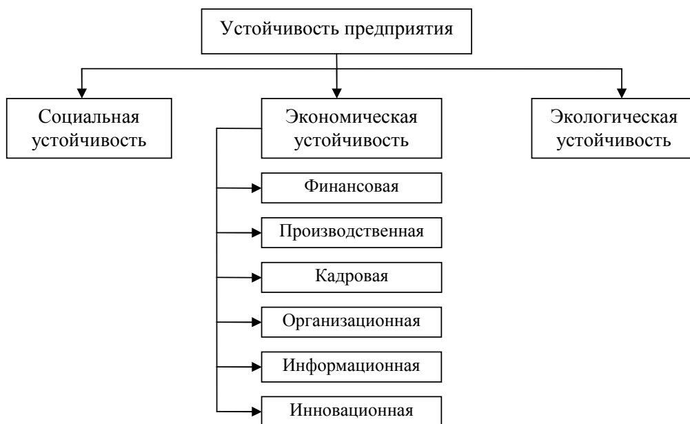
Рис.1. Структурные элементы устойчивости предприятия

Кроме того, снижение финансовой устойчивости отдельной организации неизбежно приведет к сбоям в работе всего механизма экономики. Неплатежеспособность отрицательно сказывается на динамике производства и проявляется в виде сокращения платежеспособного спроса на